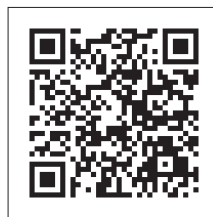
早稲田大学寄付申込